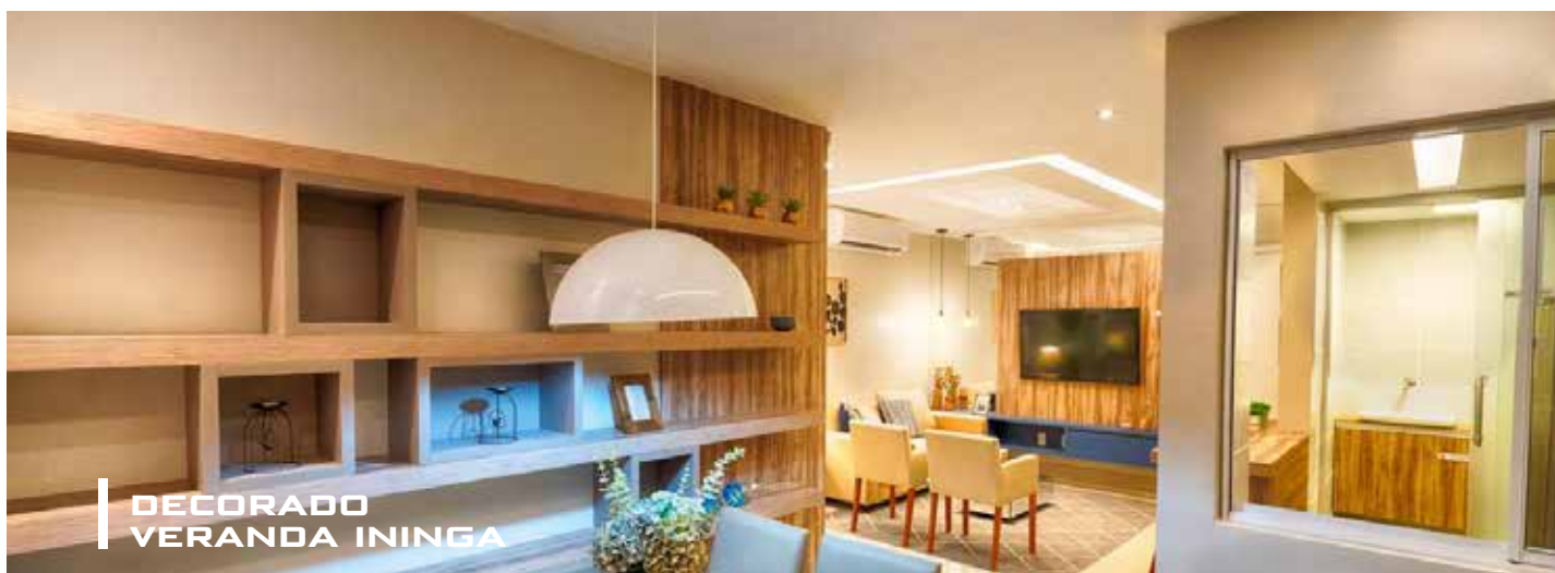
DECORADO VERANDA ININGA