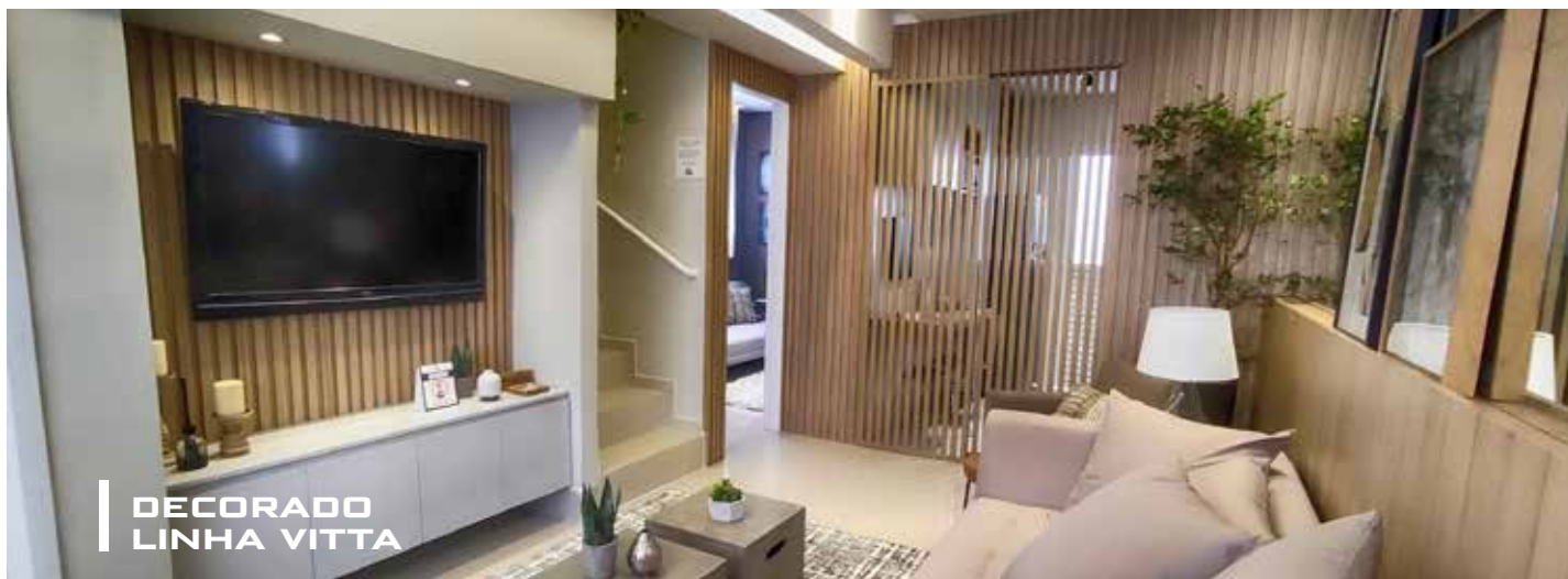
DECORADO LINHA VITTA