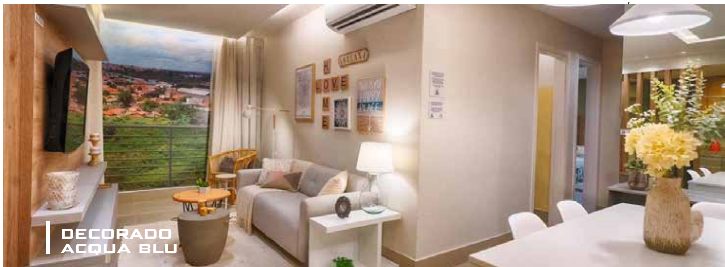
DECORADO ACQUA BLU